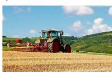
Fachkräfte für Agri-service übernehmen mit ihren Maschinen vielfältige landwirtschaftliche Dienstleistungen.

In der Land- und Ernährungswirtschaft gibt es noch offene Lehrstellen. Die 14 Grünen Berufe bieten für Jugendliche spannende und abwechslungsreiche Aufgabengebiete mit besten Perspektiven für eine sichere berufliche Zukunft.