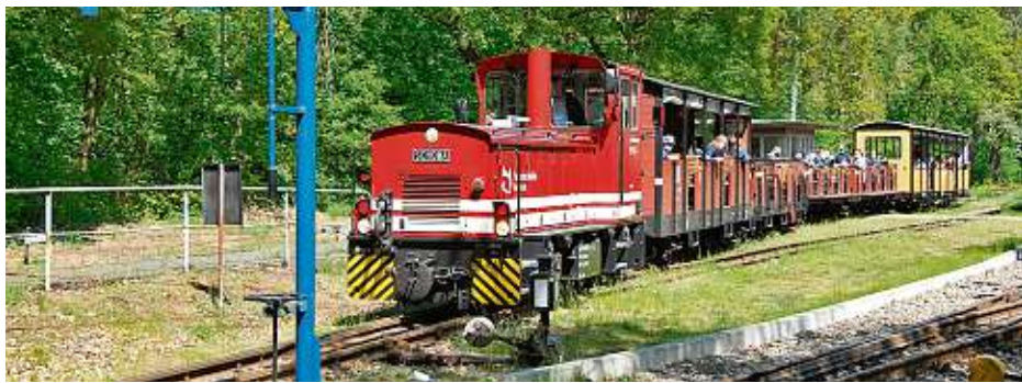
Ab diesem Wochenende rollen die kleinen Wagen wieder.