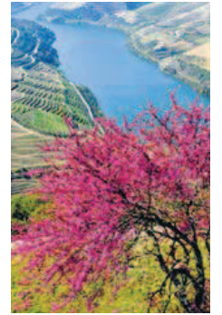
Mit der MS Douro Queen können Sie das Dourotal vom Wasser aus entdecken.

giesischen Weingut berühmte Tropfen. Und schließlich führt die Reise auch in die spanische Stadt Salamanca, die ihre Besucher ins Mittelalter entführt.