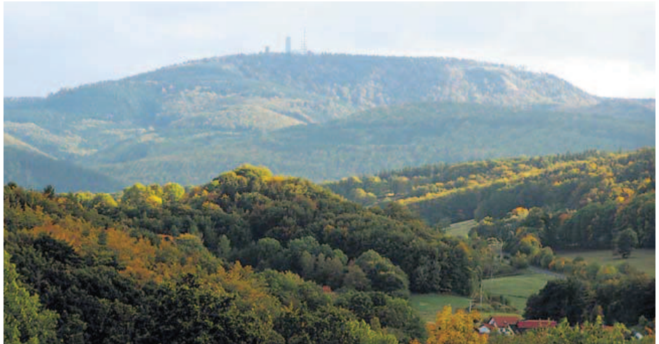
Der Große Inselfberg ist ein markanter und vielbesuchter Berg des Thüringer Waldes.