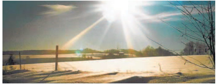
Gerade im Winter zeigt der Harz seine romantischen Seiten.

Dabei herrscht im nördlichsten Mittelgebirge Deutschlands eher ein raues Klima – geradezu trotzig ragt der 1141 Meter hohe Brocken aus Granit auf und stellt sich Wind und Regen entgegen. Die verwitterten urigen Gesteinsformationen tragen dazu bei, dass der Berg heute sagenumwoben ist. Seine wildromantischen Schluchten, Bergzüge, Hochebenen und Klippen tun ihr Übriges, um die Fantasie der Besucher anzuregen. Alle Höhenstufen vom Hügelland bis hinauf zur Brockenkuppe sind hier auf