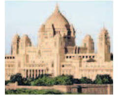
Wie aus einem Märchen: Das Palasthotel Umaid Bhawan Palace in Jodhpur.

ein Märchen wie aus Tausend und eine Nacht. Und auf Wunsch lassen sich die Rundreisen im Goldenen Dreieck durch einen Abstecher in die Wildnis ergänzen.