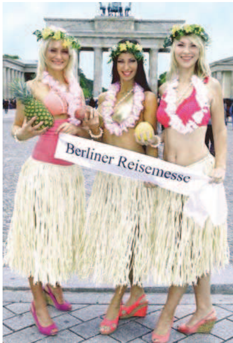
Ihrem Fernweh kann abgeholfen werden – auf der 21. Berliner Reisesmesse in Spandau.

Und zwar indem Sie sich einfach treiben und von den vielen verschiedenen Angeboten inspirieren lassen. So wird der Spaziergang durch die Hallen der Mercedes-Benz-Niederlassung in der Seeburger Straße zu einer kleinen Reise um die Welt. Schauen Sie bei den vielen Ständen zu Kur- und Wellnessreisen vorbei, informieren Sie sich über die neuen Routen der Kreuzfahrtschiffe in der Karibik, der Südsee und durch die europäischen Gewässer. Entdecken Sie das Ruppiner Land oder die Uckermark – in den vielen kleinen Hotels, Pensionen, Feriendörfern, auf Bauernhöfen, bei geführten Touren. Verweilen Sie an den wunderschönen Ostsee-Gestaden – planen Sie einen kulinarischen Streifzug durch die Küche Mecklenburg-Vorpommern oder besuchen Sie mit Quedlinburg ein einzigartiges Weltkulturerbe und erleben Sie in den pittoresken, von Fachwerkhäusern gesäumten Gassen die Geschichte des Mittelalters hautnah. Vielfalt ist Trumpf auf der Reisesmesse und es gibt so viele Anregungen, dass ein Tag kaum ausreicht, um alles zu verarbeiten. Aber vor allem gibt es viele attraktive Reiseangebote zu