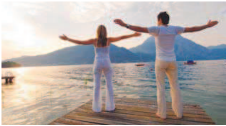
Im Urlaub aktiv die Gesundheit und Leistungsfähigkeit stärken wird immer beliebter.