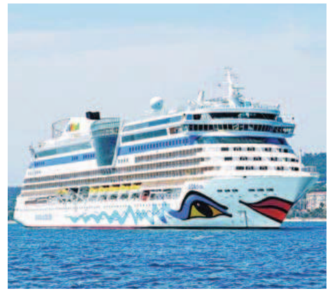
Die AIDAdiva auf Kreuzfahrt im Mittelmeer.

und unendlich viele Erlebnisse: Kommen Sie beispielsweise in Dubai an Bord und reisen Sie mit der EUROPA zu den traumhaften Seychelleninseln. Bestaunen Sie die „Big Five“ in Südafrika und erleben Sie die grandiosen Landschaften an der Spitze Südamerikas. Auch Neuseelands Nord- und Südsüdpole präsentieren Ihnen spektakuläre Natur. Ist der asiatische Kontinent erreicht, begeistern die weißen Strände der Philippinen und Metropolen wie Hongkong und Singapur. Und wenn Sie Weihnachten gern zu Hause feiern möchten, wählen Sie die Weltreise-Alternative „Auf Großer Fahrt“, die im Januar 2013 in Valparaiso beginnt.