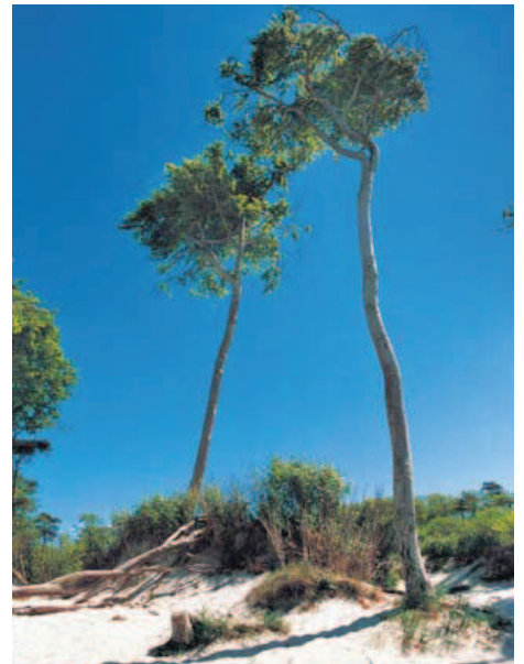
Auf dem Darß begegnet dem Besucher manchmal noch eine wilde ungebändigte Natur.

Einen weiteren wichtiger Schritt hin zu einem behutsamen Tourismus machte der Küstenabschnitt schließlich 1990. Damals wurden die einmaligen Naturräume unter den Schutz des Nationalparks „Vorpommersche Boddenlandschaft“ gestellt und bieten heute Rückzugsräume für viele Tierarten – und den Menschen eine Oase der Ruhe und Erholung.