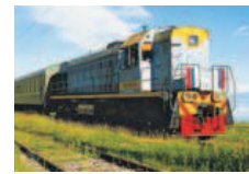
Mit der Transsib durch Russlands ferne Weiten.

Mit dem Zarengold-Zug den fernen Osten entdecken