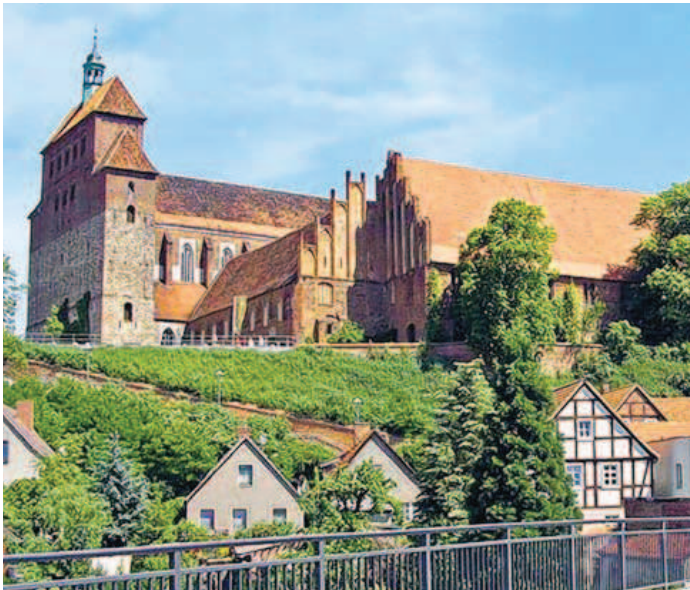
Der mächtige Havelberger Dom ist ein Wahrzeichen der Prignitz.