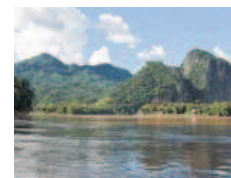
Der Mekong, die Lebensader Südasiens.

Das ausgefeilte, auch Länder übergreifende Bausteinprogramm des Berliner Reiseunternehmens öffnet Ihnen dafür die ganze Vielfalt der faszinierendsten Länder dieser Welt. Das gilt zum Beispiel für Laos, das kleine,