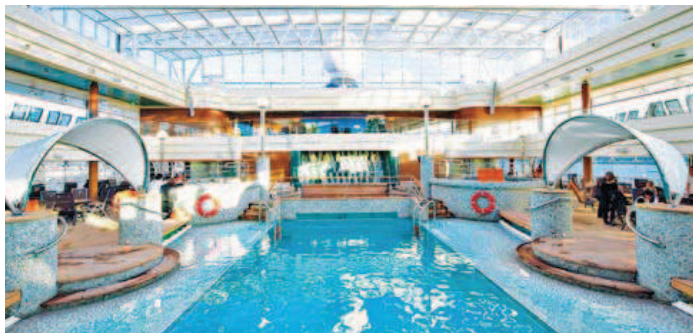
Hier fehlt es an nichts: Badelandschaft auf der MSC Magnifica.