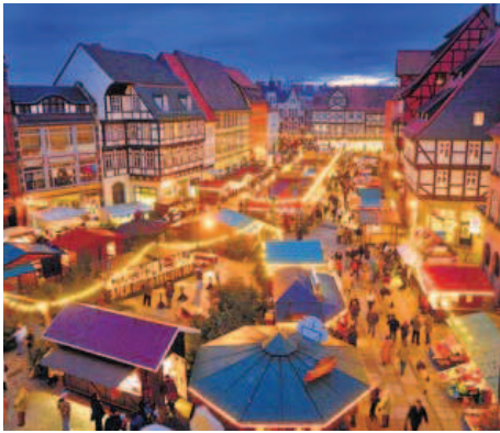
Es ist der Inbegriff der romantischen Adventszeit: der Weihnachtsmarkt in Quedlinburg.

Der Harz – Erholung in der Mitte Deutschlands