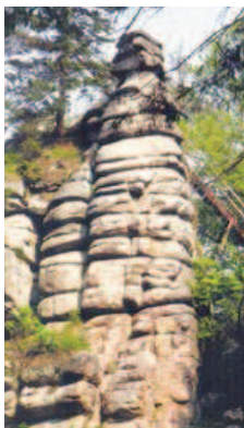
Der Haberstein mit seinen „Druidenschalen“ lässt Raum für Fantasie.

Das Fichtelgebirge im Herzen Deutschlands verbindet den Frankenwald mit dem Oberpfälzer Wald. Der höchste Gipfel und gleichzeitig höchster Berg Frankens ist der Schneeberg mit 1051 Metern, gefolgt vom Ochsenkopf mit 1024 Metern. 1990 wurde das Fichtelgebirge zum Naturpark erklärt. Zwischen den Zentren Hof, Bayreuth und der tschechischen Stadt Egger (Chleb) gelegen, umfasst der Park heute eine Fläche von