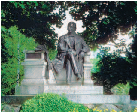
Theodor Fontane hat die Schönheiten des Ruppiner Lands ins Blickfeld der Öffentlichkeit gerückt.

An Land warten auf die Freizeitkapitäne historische Stadtkerne, stille Dörfer und romantische Städtchen, verbunden durch prächtige Alleen, schmucke Kirchen, die Deutsche Tonstraße sowie zahlreiche Schlösser und Her-