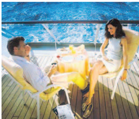
Auf der Veranda der MS Europa kann man beim Frühstück den Blick bis zum Horizont schweifen lassen.

Und das ganz Besondere bei AIDA: Bei aller Abwechslung wird Qualität bis ins letzte Detail groß geschrieben. Die exzellente, hochwertige Küche überzeugt jeden Gaumen, in AIDA Spa & Sports kommen Körper und Geist auf ihre Kosten und das professionelle Entertainment-Programm begeistert und reißt mit.